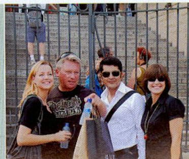
Flanieren an der Promenade